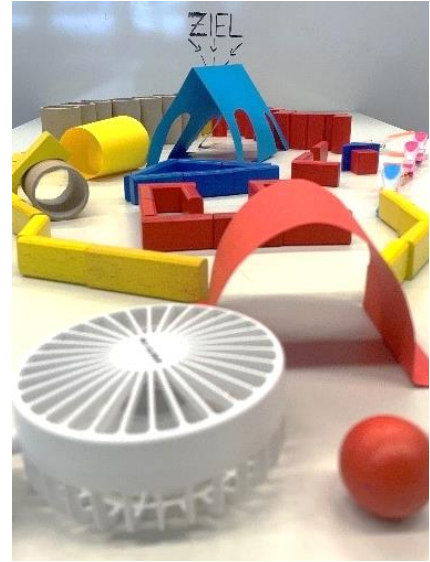
Bild 6: Ball durch den Luftparcours zum Ziel pusten (Forscherstation)