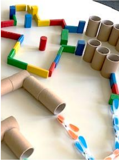
Bild 4: Aus verschiedenen Materialien einen Luftparcours bauen (Forscherstation)