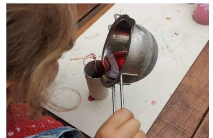
Abbildung 2: Wachs eingießen (Forscherstation)