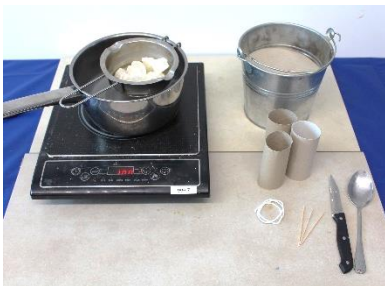
Abbildung 1: Materialien (Forscherstation)