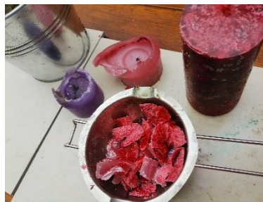
Abbildung 2: Wachs vorbereiten (Forscherstation)