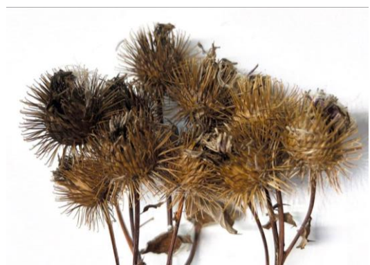
Forscherstation, Kletten von der Distel

Für den Wettbewerb haben wir eine Geschichte zum Thema Bionik geschrieben. Unsere Geschichte dient als Ausgangsimpuls um zu verstehen, was Bionik ist. Bionik ist eine Idee, die wir uns bei der Natur „abgeschaut“ und uns zu Nutze gemacht haben. Wir haben quasi eine Funktionsweise aus der Natur nachgebildet. Die Geschichte beschreibt wie Kai Klötzchen und die Kinder ein Beispiel für Bionik in der Natur entdecken und sich daraufhin die Frage stellen, welche Beispiele es noch gibt und wie sie diese nutzen können. Ein idealer Einstieg ins Thema Bionik wäre, sich ein oder mehrere Beispiele aus der Lebenswelt der Kinder anzuschauen und sich gemeinsam zu überlegen wie man noch weitere entdecken, nachbilden oder nutzen könnte um den Alltag in der Kita noch interessanter zu machen oder gar zu erleichtern. Die Kinder befassen sich anschließend über einen Zeitraum von mindestens vier Wochen mit dem Wettbewerbsthema „Bionik – Lernen von der Natur“.